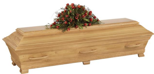
Kista i massiv ek, siden matt. (Ekenäs)