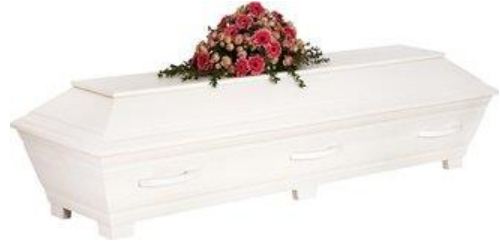
Kista furu, målad vit. (Sandholm)

Kistdekoration som är på bilden ingår ej.