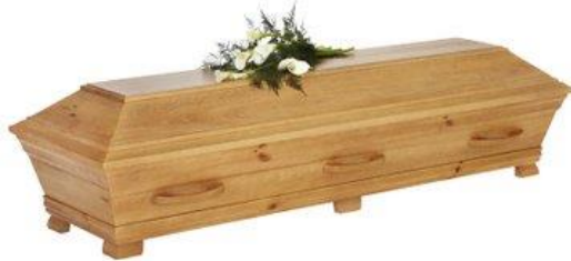
Kista i furu, ek bets. (Alvö)