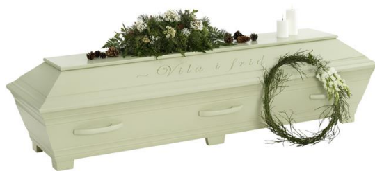
Kista furu, Lindblomsgrön (Kullamark) med avskedshälsning ingraverad

Kistdekoration som är på bilden ingår ej.