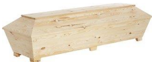
Kista i ren obehandlad furu. (Ängsro)