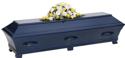
Kista i furu, lackad i solidfärg, midnattsblå (Hovdala)