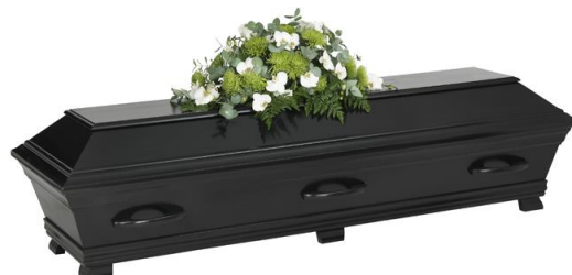
Kista furu, lackad i solidfärg, svart (Hovdala)

Kistdekoration som är på bilden ingår ej.