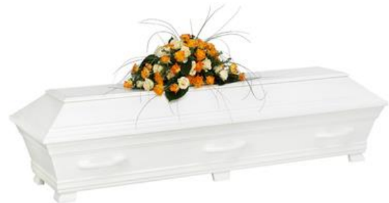
Kista furu, solidvit (Alvö)

Kistdekoration som är på bilden ingår ej.