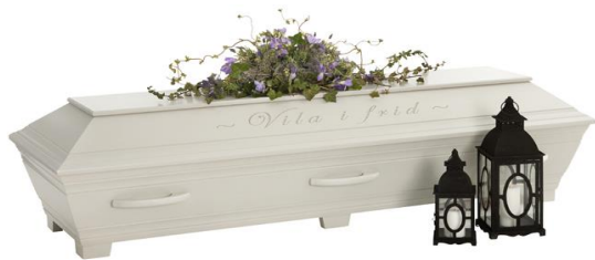
Kista i furu, målad, (Kullamark) Allmogegrå med avskedshälsning ingraverad