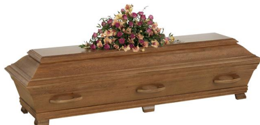
Kista i massiv ek, betsad (Ekenäs)

Kistdekoration som är på bilden ingår ej.