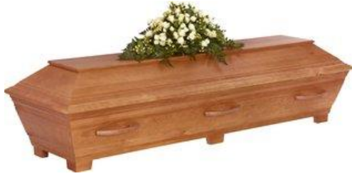
Kista i furu, målad antik brun. (Sandholm)